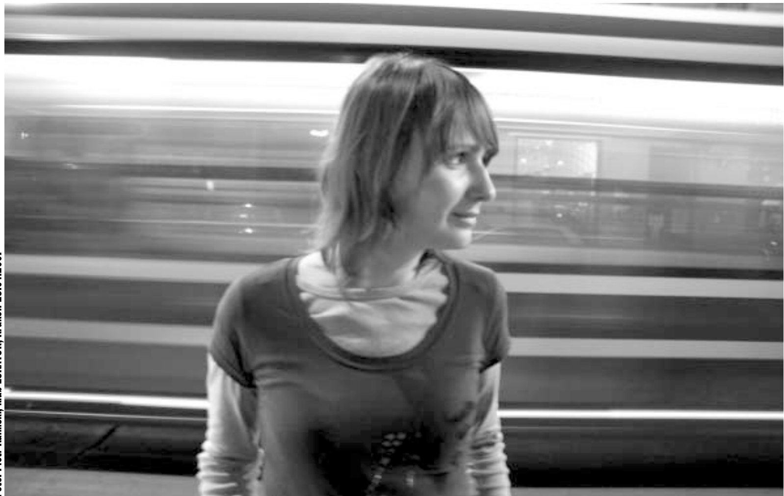
Klub LOKATOR, Kraków 23.04.2007