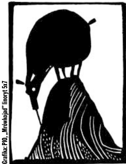
Grafika: PIO, „Mrówkojad” inoryt 5x7