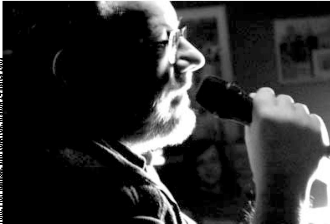
Klub LOKATOR, Kraków 24 marca 2007

Najprostsze obroty, które wszyscy znają, a niektórzy praktykują, to palindromy, których część należy wręcz do dziejów kultury, jak „Roma – Amor” czy „Times – Semit”, albo awansowały na tytuły, jak „Sopot – topos”. Ujawniają czasem sekretne związki, jak „Remus – Sumer”, „Zeus – Suez”, „Seul – lues” czy „karabela – ale barak”, lub atakują tajemniczym dopowiedzeniem, jak „Ukrywana – a na wyrku”, „pokaz – zakop”, „laptop – podpal”, „nadmetraż – żartem dan”, „umór – rumu”, a posiadacze niektórych imion mogą mieć za złe, że objawiają: „Tomasz – szamot” czy „Igor – rogi”. Osobiście bardziej od sławetnej kobyły, co ma mały bok, wolę stwierdzenie: „A tu mamy złoto – oto lzy mamuta”. Inny znany rodzaj obrotów to metamorfoza anagramatyczna, czyli metaformoza, z reguły przybliżona, z takimi efektami, jak „banan – nabab”, „bizon – zombi”, „kynolog – golony”. Osobiście bardzo się kiedyś ucieszyłem, kiedy w obrocie Edgar Allan Poe ujawnił mi się jako „legalna torpeda”. A stąd już krok do najbardziej znanej gry, czyli półsłówki: „do stóp”, „urząd nieczynny”, „mała piła”, „kot Luśki”, „żart na stonkę”,