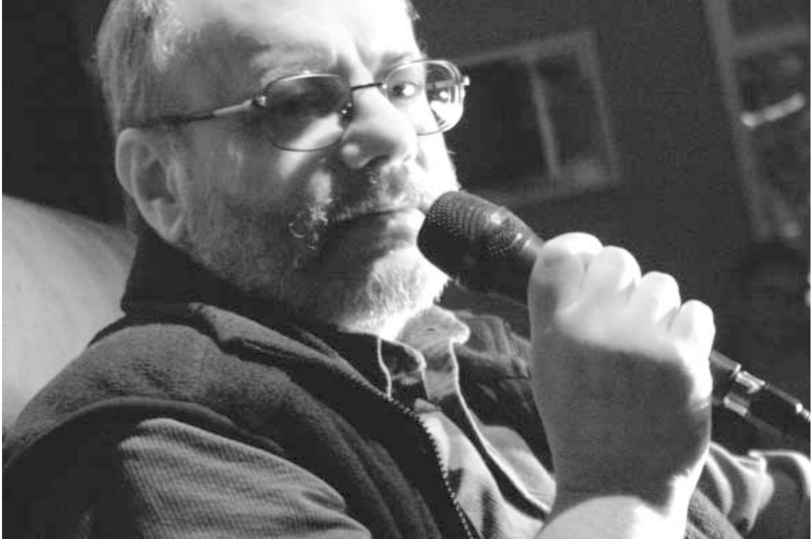
Kraków 24 marca 2007